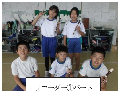
リコーダー①パート