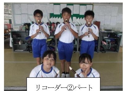
リコーダー②パート