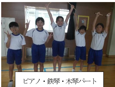
ピアノ・鉄琴・木琴パート

夏休み明けから、学習発表会や五位小との音楽交流会に向けて合唱や合奏の練習に励んでいます。先日は、五位中学校の村田先生をお迎えし、歌い方や演奏のポイントを分かりやすく教えていただきました。学習発表会当日は、素敵な歌声や音色、子供たちの頑張る姿をどうぞご覧ください。